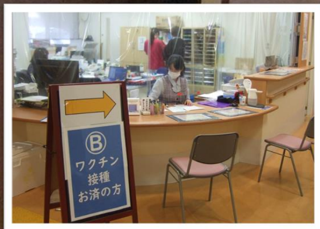
写真：中央...接種会場、左下...接種前受付、右下...接種後受付